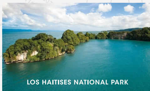
LOS HAITISES NATIONAL PARK