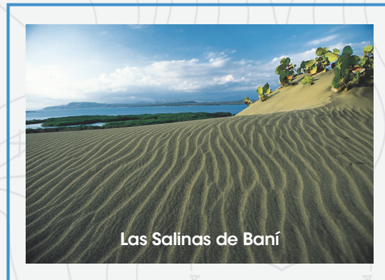
Las Salinas de Baní

Desde allí podrás observar diversidad de animales y plantas, manantiales de agua dulce bajo la arena, un sendero de los caracoles y una reserva de fósiles prehistóricos y elementos de valor arqueológico. Los atardeceres se aprecian de forma espectacular.