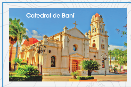
Catedral de Baní

Durante tu visita, además de Las Salinas de Baní , podrás ver las dunas formadas por los sedimentos del arroyo Bahía, del río Baní y del río Nizao. También podrás apreciar la Catedral de Baní que con un estilo sencillo colonial, alberga la imagen de la Virgen de Regla, patrona de la Provincia de Peravia. El Centro Cultural Perelló te ofrecerá toda una colección referente a la cultura dominicana y la Playa Salinas sin duda es otro de los lugares que no puedes dejar de visitar.