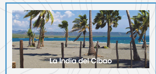
La India del Cibao

Alrededor de Las Salinas de Baní encontrarás la Playa Punta Salinas , Playa el Derrumbao , Playas de Meganito , el Club Náutico Las Calderas y podrás apreciar la Bahía Las Calderas . Asimismo, está el Sendero los 4 Mangles , Capilla Sagrado Corazón de Jesús , Pink Lake , entre otros incluyendo hospederías y restaurantes .